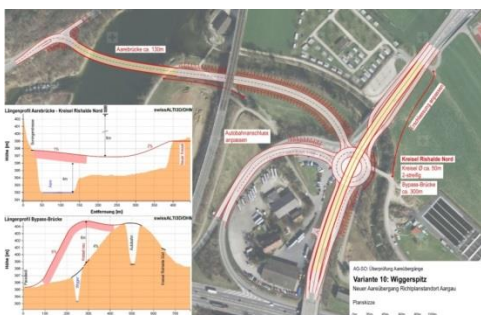
Projektstudie für Variante 10

Das Variantenstudium erfolgte zweistufig: In einer ersten Phase wurden 16 Kombinationen aus 7 verschiedenen Ersatzstandorten und 3 verschiedenen Regimes an den verbleibenden Aareübergängen gebildet und grob beurteilt. Auf Grund dieser Einschätzungen wurden 6 Varianten ausgewählt, welche vertiefter untersucht und detailliert bewertet wurden.